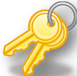
Peça de metal